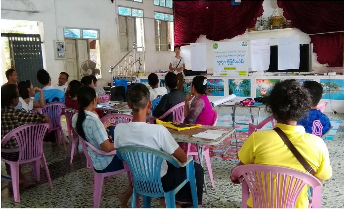
၉။ ကျေးရွာစီမံခန့်ခွဲရေးအဖွဲ့၏ အဖွဲ့ဝင်များစာရင်း။